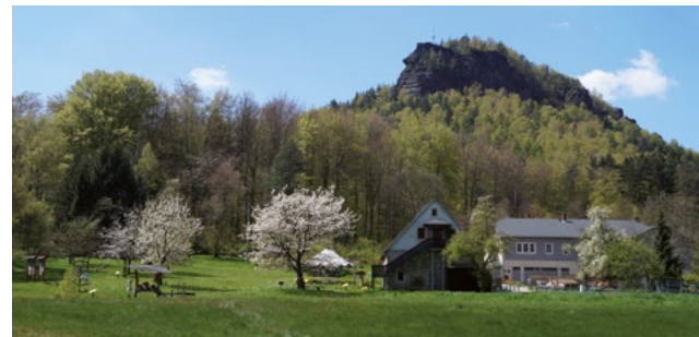
Kinder- und Jugendbildungsstätte Sellnitz der Nationalparkverwaltung Sächsische Schweiz (am Lilienstein, siehe S. 22)

Nationalpark *besuchen* *durchqueren* *erfahren* *erkunden* *erleben* *schmecken* *Spieletreff* Ausgangspunkt: Königstein