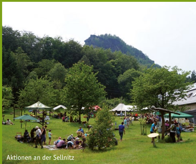
Aktionen an der Sellnitz