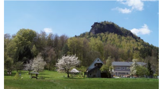
Kinder- und Jugendbildungsstätte Selznitz der Nationalparkverwaltung Sächsische Schweiz (am Lilienstein, siehe S. 22)