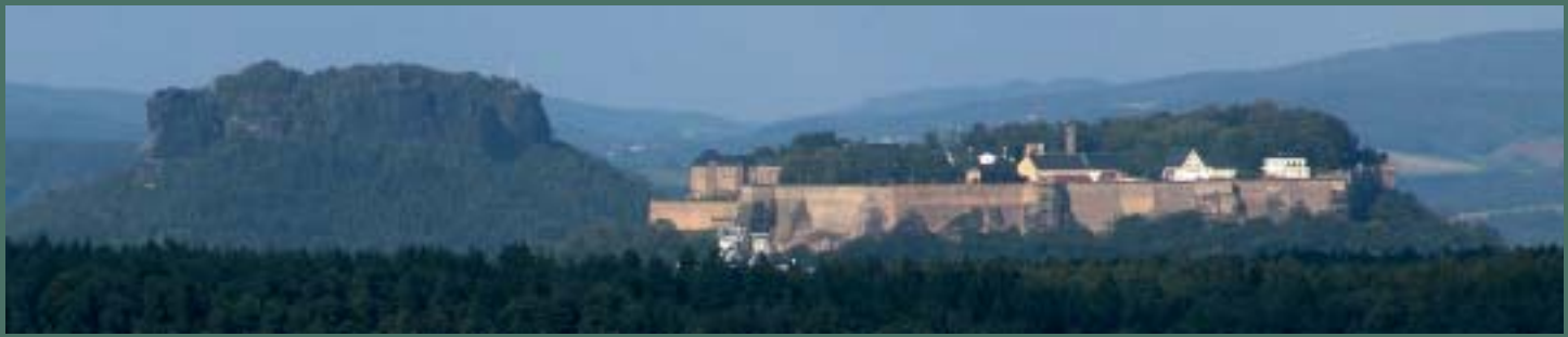
Blick vom Cottaer Spitzberg zum Lilienstein und zur Festung Königstein