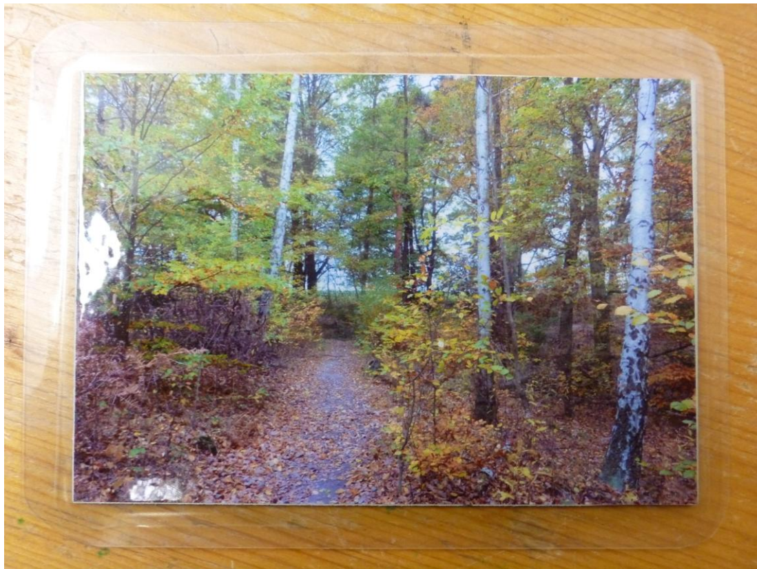
Abb. 4: Wegekarten des Teilbereichs „Photosynthese“ von vorne