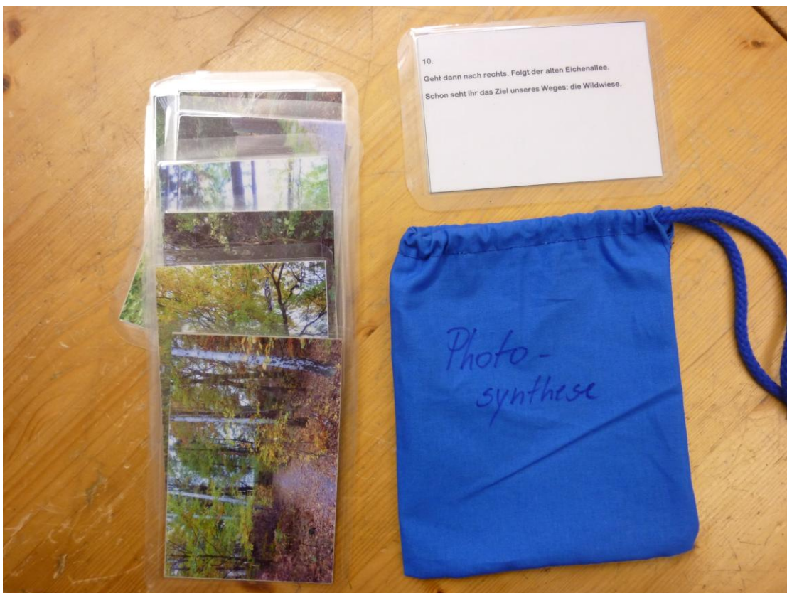
Abb. 2: Projekt Wegekarten und Beutel des Teilbereichs „Photosynthese“