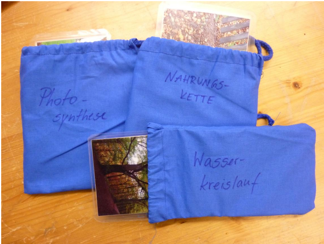
Abb. 1: Projekt Wegekarten Wildwiese