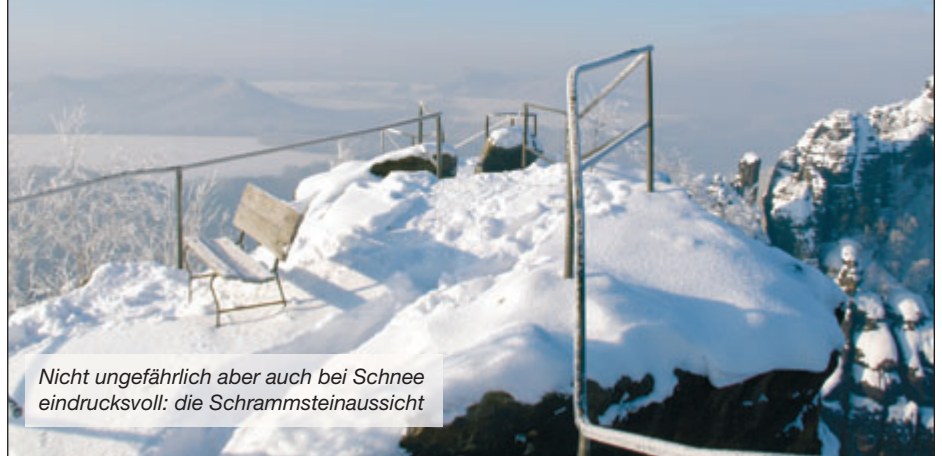
Nicht ungefährlich aber auch bei Schnee eindrucksvoll: die Schrammsteinaussicht