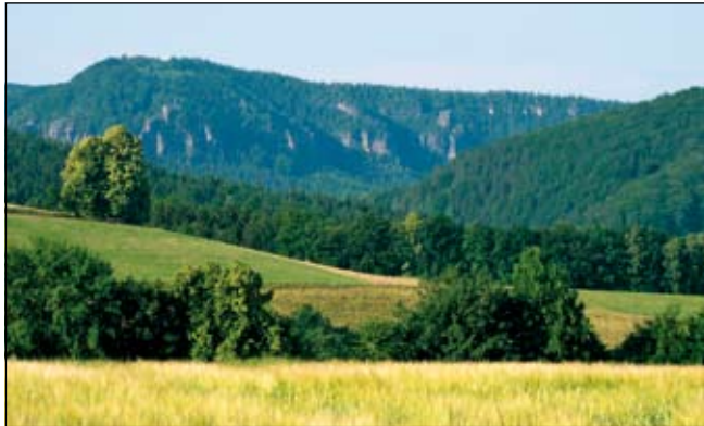
Maßnahmen zum Schutz, zur Pflege und der Entwicklung von Natur und Landschaft müssen immer sowohl Nationalpark als auch das Landschaftsschutzgebiet Sächsische Schweiz vor Augen haben. Dazu dient unter anderem auch das neu zu entwickelnde Rahmenkonzept für das Landschaftsschutzgebiet

lich verbesserte Akzeptanz und damit Wirksamkeit des Rahmenkonzepts. Rund zwei Jahre dürfte die Arbeit der Experten dauern, die immer wieder zu Arbeitsgruppen zusammentreffen. Für das Rahmenkonzept gibt es ein bedeutendes Vorgängerpapier: 1978 wurde der Landschaftspflegeplan in Kraft gesetzt. Dieser hatte bis 2003 Gültigkeit und wurde auch herangezogen, wenn es galt, Bauvorhaben in der Sächsischen Schweiz auf ihre Landschaftsverträglichkeit hin zu überprüfen.