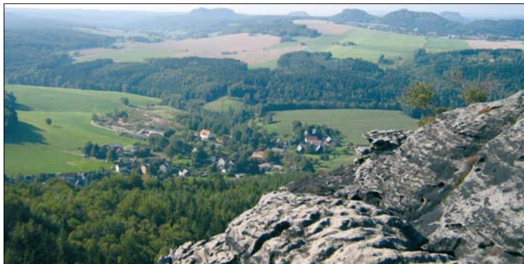
„Noch immer eine auch für Kenner überraschende Perspektive – der Blick vom Kleinen Zschirnstein über die linkselbische Nationalparkregion.“

die hochwertigen Naturerlebnisse und beeindruckenden Ausblicke. Aus naturschutzfachlicher Sicht kann die stärkere Entdeckung der linkselbischen Gebiete vor allem an Schwerpunkttagen auch eine deutliche Entlastung der Wanderwege im Nationalpark ergeben.